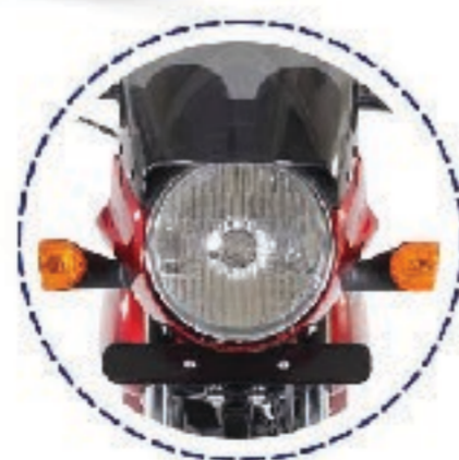
AMPLIA LUZ CENTRAL PARA MEJOR VISIBILIDAD